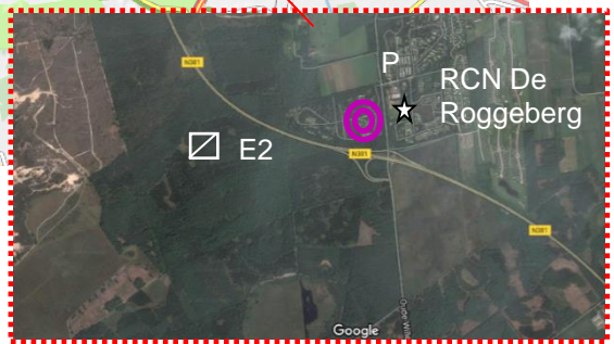
Locatie Etappe 2