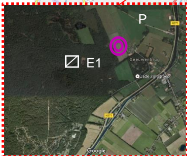
Locatie Etappe 1